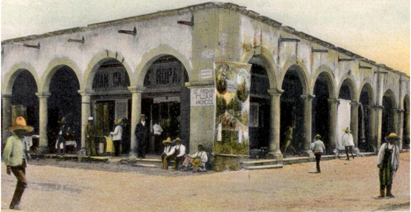
lo. 10. Parian Portales-Allende é Hidalgo, Aguascalientes.